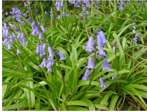
wilde hyacint in het bos